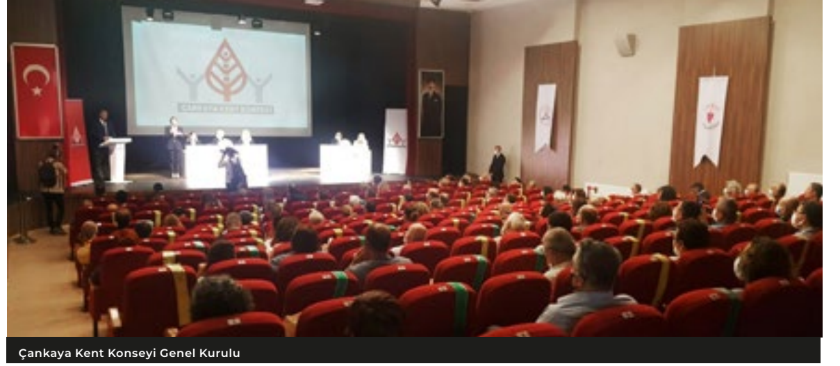
Çankaya Kent Konseyi Genel Kurulu

O gün, 25 Mayıs 2019 Cumartesi günü salonda ve bahçede heyecanlı bir kitle vardı. Misafirler arasında Çankaya Belediye Başkanı ve CHP Çankaya İlçe Başkanı da mesai arkadaşları ile birlikte gelmişler ve ön sıralarda yerlerini almışlardı. Zira bu kez Kent Konseyi Genel Kurulu farklı bir içerik ve coşku ile gerçekleşecekti.