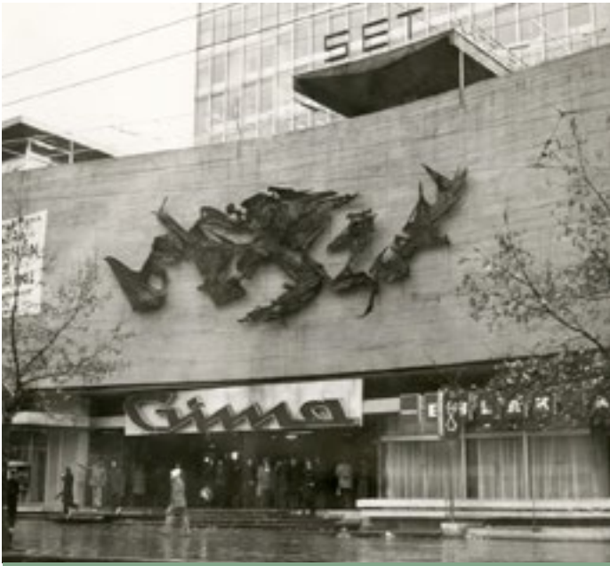
Kuzgun Acar'ın Ankara Kızılay Meydanı'nda bulunan Emekli Sandığı Gökdeleni'nin cephesine yaptığı "Türkiye Heykeli" 1967