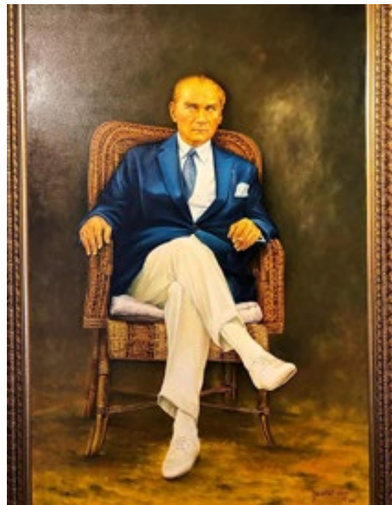
Atatürk, Tuval üzeri yağlıboya, 100x150 cm