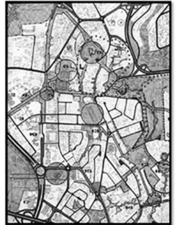
ULUS TARİHİ KENT MERKEZİ KALE ARASINDA YAYA – TAŞIT KORİDORLARI VE ÖZEL PROJE ALANLARI ÖNERİSİ (Soldaki Şema)

Servis araçları, MİA içinde sadece servis amaçlı yollardan, denetimli servis yollarından servis vermelidir. Ancak, yangın, sağlık, çöp toplanması vb. durumlarda bu tür araçların meydan/yaya yolları vb. her kesimin girebileceği düşünülmelidir. Çevre dostu akülü araçlarla, iç servis hizmetlerinin yapılması sağlanmalıdır (Tunçer, M., 1994, Güzel Şehir İlkeleri : Eski Prag-Eski Ankara, S.207-208).