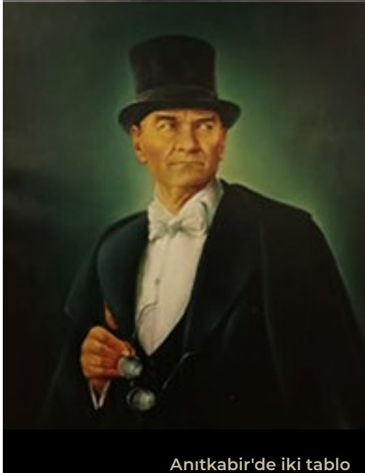
Anıtkabir'de iki tablo