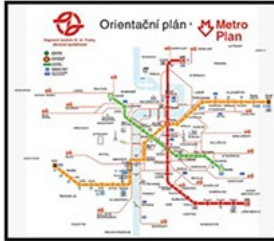
PRAG METROSU VE TRAMVAY SİSTEMLERİ

sistemi, yerleşim yerinin araç değil insan odaklı olabilmesi için çok önemlidir. Toplu ulaşım durak ve istasyonları iyi tasarlanmış ve yürüme mesafeleri de dikkate alınarak doğru konumlandırılmış olmalıdır. Toplu ulaşım araçları erişilebilirlik standartlarına uygun olmalıdır. Toplu ulaşım entegrasyonu sağlanmalıdır. Ana aktarma noktalarında farklı işlevler ve donatılara da yer verilmelidir.