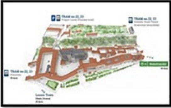
PRAG KALESİ'NE ULAŞIM VE KALE İÇİ YAYA SİSTEMİ

"Güzel Şehir" Prag'ı keşfetmenizi sağlayacak güzergâh yine tarihinde saklıdır. "Kral yolu" olarak adlandırılan, Barut kapısı "Pražska Brana" veya "Powder Tower" diye turistik haritalarda gösterilen noktadan başlayıp, Prag kalesindeki St.Vitus Katedrali'nde sonlanan rota, sizlere şehrin tüm önemli yapılarını gösterecektir. Prag kalesine doğru yokuş yukarı tırmanmamak için bu güzergâhı tersten yürümeyi tercih edebilirsiniz. Sizler de derseniz şehrin en uzun tramvay hattı 22 numaralı tramvay ile "Pražský Hrad" durağında inip, Prag Kalesi'nden başlayarak şehir turunuzu yapabilirsiniz...." (Sayfa 125)