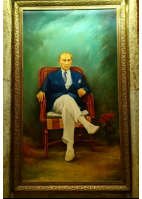
Atatürk, Tuval üzeri yağlıboya, 110x196 cm

"Ortaokuldan beri" diyerek açıklamış ama lise öğretmenleri Cemal Bingöl, Cemal Güvenç ve Bahattin Akay'ı