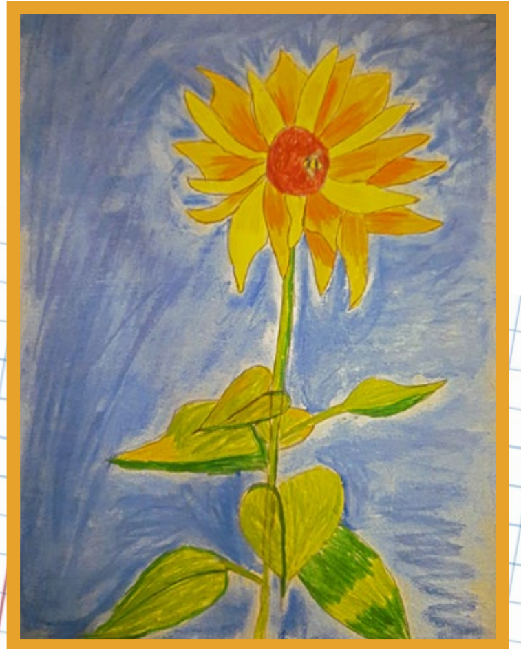
Resimleyen: Ada Su BAŞÇILAR