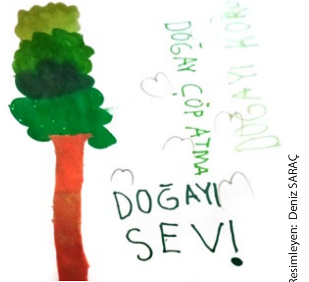
Resimleyen: Deniz SARAC