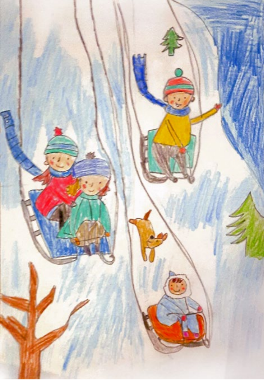
Resimleyen: Ada Su BAŞÇILAR