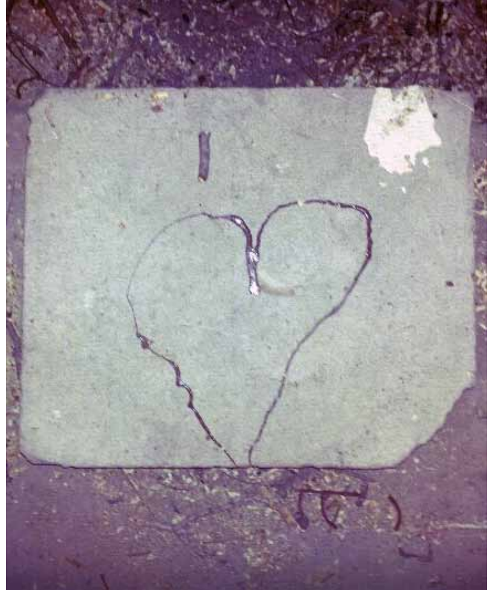
Keneddy Caddesinde köşesinde bir ağaç dibi...

Türkiye'deki üç operatör, birbirlerinden müşteri kapma yarışından zaman bulup da bırakın önlem almayı, üç kat fazla sayıdaki baz istasyonunun üçte ikisini ortadan kaldıracak protokol için yıllardır ayak sürüyorlar. "Ya Ulaştırma Bakanlığı, peki Sağlık Bakanlığı ne yapıyor?" dediğinizi duyar gibiyiz. Haberde onların adlarını bile geçirmeyecektik aslında. Olayın o kadar dışındalar... / Solfasol