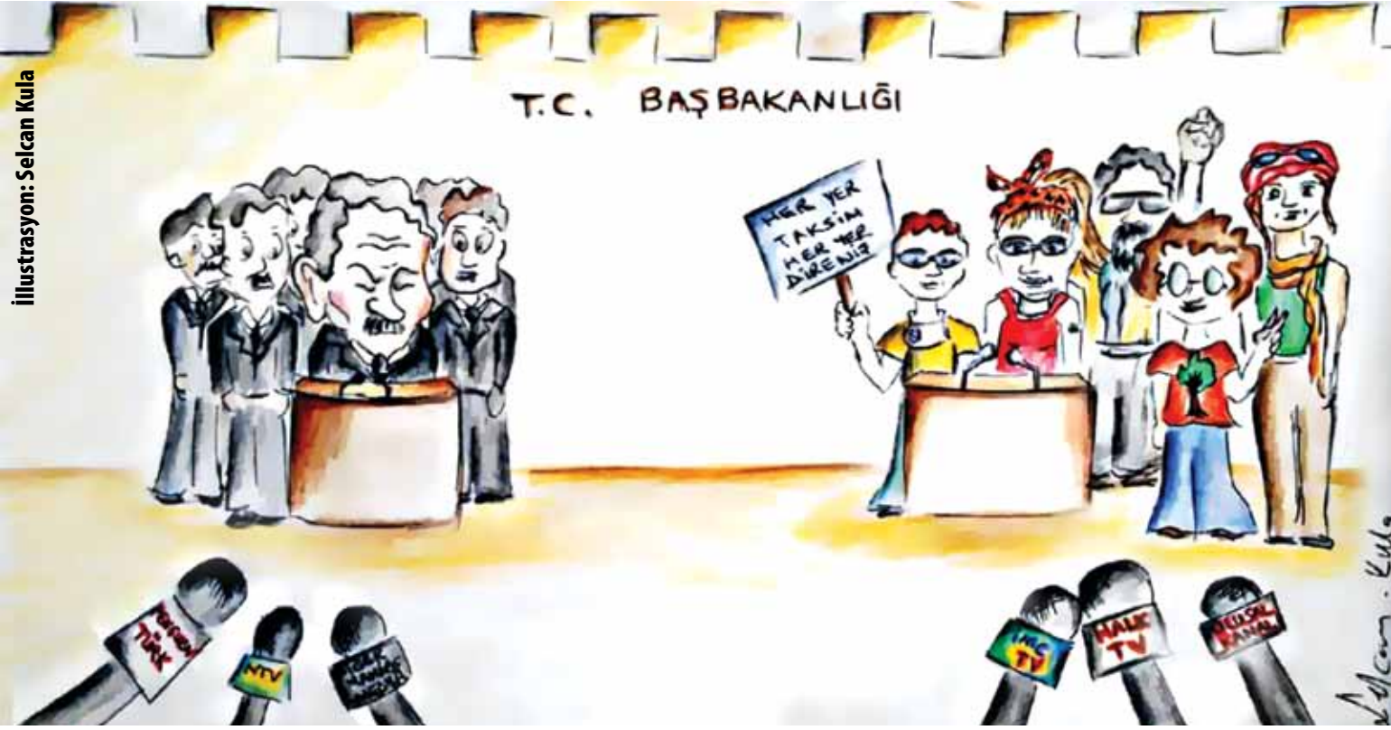
İllustrasyon: Selcan Kula