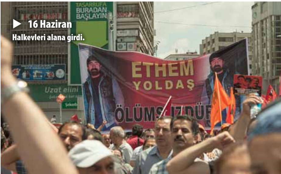
► 16 Haziran Halkevleri alana girdi.

03:27 (16.06.2013) CHP'lilerin polisle müzakeresi sonucu polis çekildi, kalabalık dağıldı.