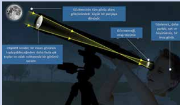
Şekil 1 : Mercekli teleskobun çalışma prensibi...

Mercekli (Refraktif veya dioptrik) teleskoplar, ışığı toplamak için mercek takımı kullanan teleskoplardır. En basitinden bir dürbün ile aynı mantıkta çalışırlar. İlk mercekli teleskop 1608 yılında Hollandalı bir gözlük üreticisi olan Hans Lippershey tarafından tasarlanmış olup, bu teleskobu gökyüzü gözlemlerinde ilk kez Galileo Galilei 1609 yılında kullanmıştır. O zamandan bu zamana mercekli teleskopların tasarımı benzer olsa da gelişen teknoloji ve artırılan mercek kaliteleri