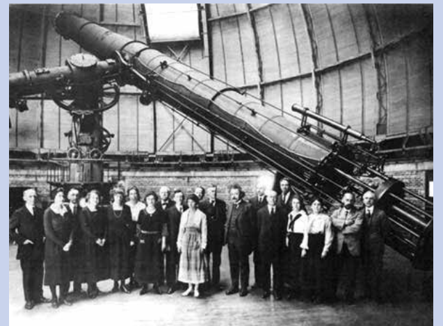
Şekil 2: Astronomik çalışmalarda kullanılmış dünyanın en büyük mercekli teleskobu 1000 mm'lik (40 inç) çapı ile Yerkes Gözlemevinde bulunmaktadır.

Önümüzdeki ay "Aynalı" teleskopları daha yakından inceleyeceğiz.