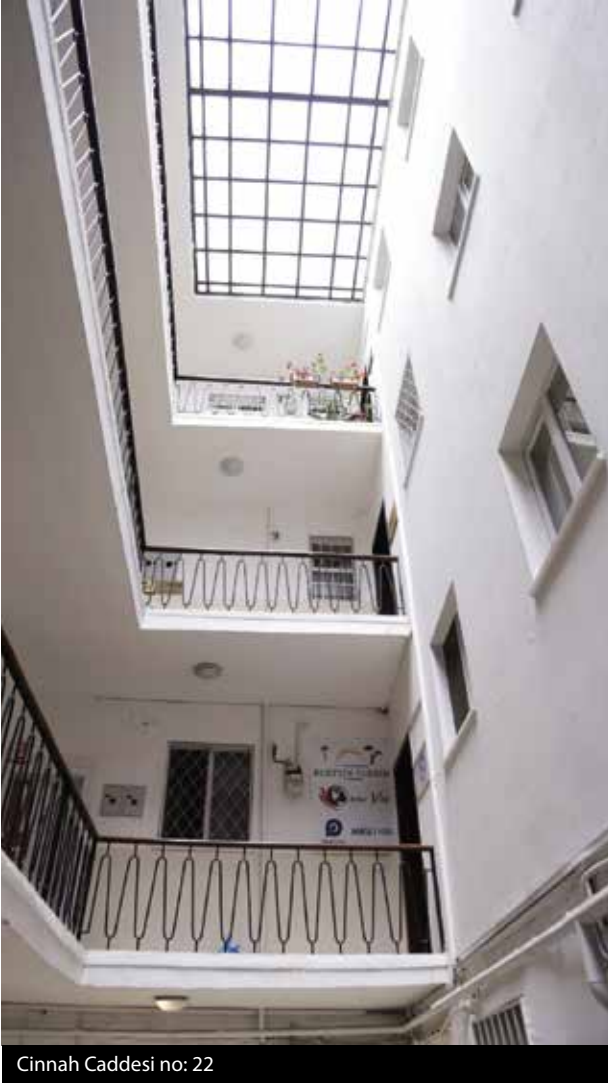
Cinnah Caddesi no: 22