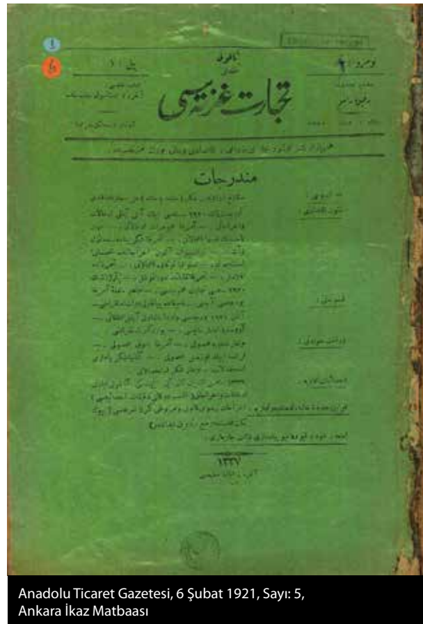
Anadolu Ticaret Gazetesi, 6 Şubat 1921, Sayı: 5, Ankara İkaz Matbaası