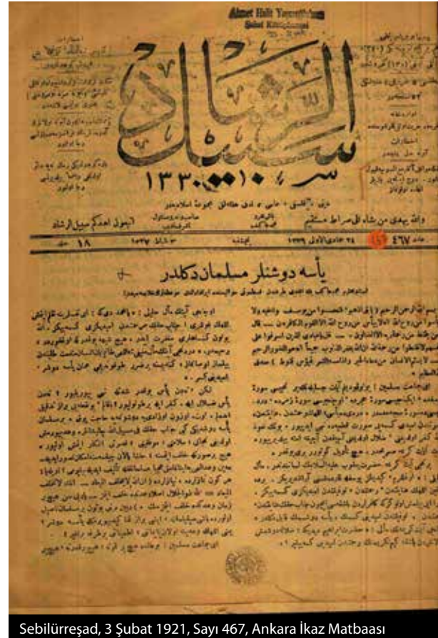
Sebülürreşad, 3 Şubat 1921, Sayı 467, Ankara İkaz Matbaası