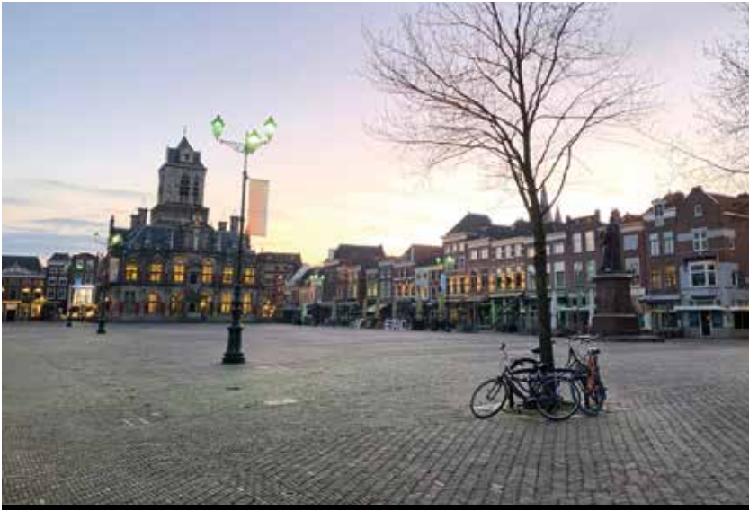
Normalde cıvıl cıvıl olan Delft Meydanı, ortadaki yazı "mesafe" kelimesinin Hollandacası

Her şey çok hızlı ilerledi. Bundan iki ay önce hiçbir Avrupa vatandaşı aylarca sadece alışverişe gidebilmek için evden çıkabilecek olma halini aklına bile getiremezdi. Bugün İtalya'da izolasyon ikinci ayını tamamlamaya yaklaşırken, İspanya, Almanya, İsveç, Finlandiya, Hollanda gibi birçok ülkede de birinci ayını doldurdu. Ama bu yazı virüsün kendisi, ciddiyeti veya yayılmasının farklı ülkelerce yönetilme şekli ile ilgili değil. Köşenin adına yaraşır bir biçimde güzel ve umut verici şeyler anlatacağım. Bu bölümde, tam otuz gündür çıkmadığım evimden gözlemleyebildiğim kadarıyla, tüm dünyayı etkisi altına alan, bütün bildiklerimizi unutturan, yaşamı sorgulatan Covid-19 mücadelesinin gün yüzüne çıkardığı, izolasyon süreci uzadıkça çığ gibi büyüyen dayanışma inisiyatiflerinden bahsedeceğim.