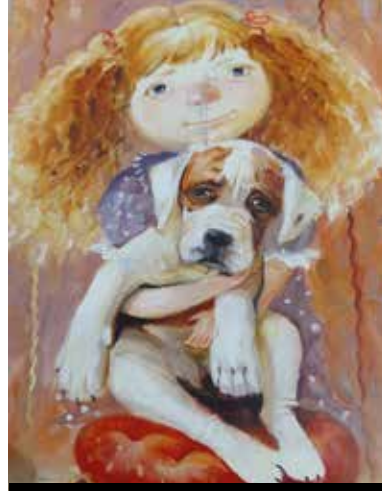
Postcrossing üzerinden Rusya'dan bana yollanan bir kartpostal.