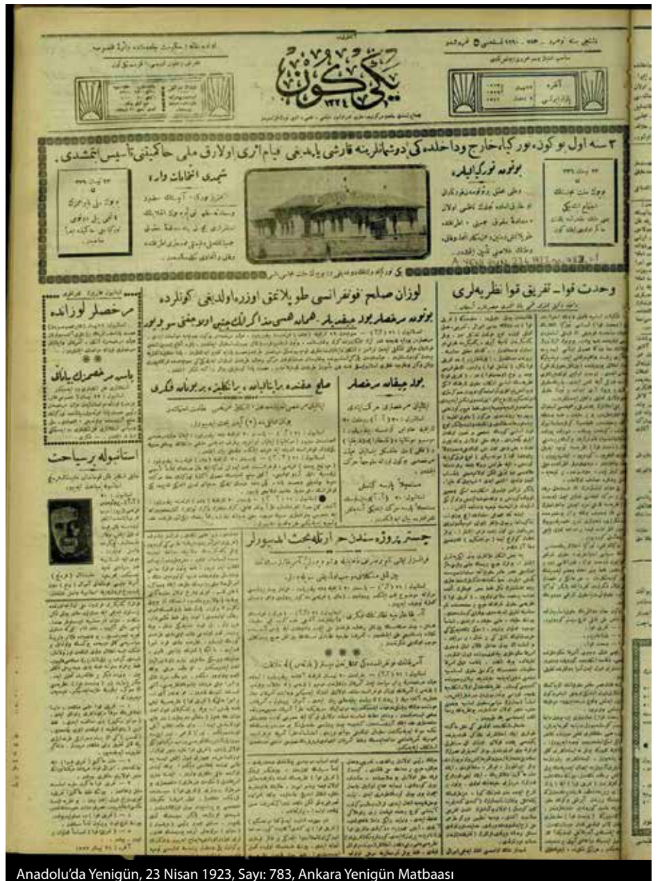
Anadolu’da Yeniğün, 23 Nisan 1923, Sayı: 783, Ankara Yeniğün Matbaası