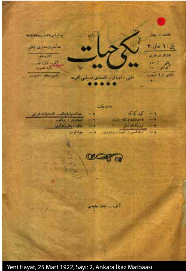
Yeni Hayat, 25 Mart 1922, Sayı: 2, Ankara İkaz Matbaası

“Birinci Meclis döneminde Ankara'da iktidarı destekleyen söylemleri ile edebiyat içerikli Anadolu Duygusu; eğitim içerikli Anadolu Terbiye Mecmuası, bilim ve sanat içerikli Anavatan Mecmuası, Matbuat ve İstihbarat Matbaası'nda basılan siyaset içerikli Köy Hocası, ekonomi odaklı Anadolu Ticaret Gazetesi ve gayri-resmi askeriyenin ilerlemesi içerikli Milli Ordu dergileri yayımlanmış, kısa ömürlü bir yayın çizgileri olmuştur.”