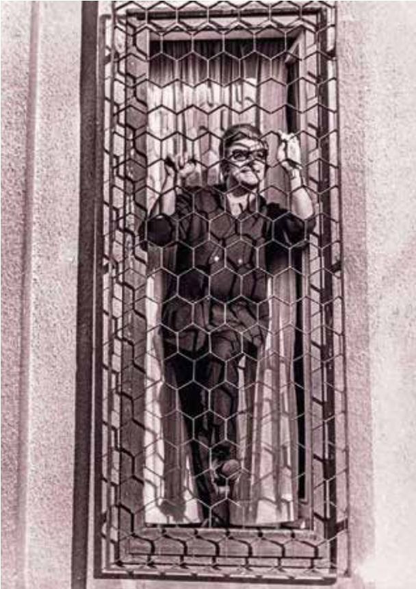
Petekevler'in petekli demirlerinin arkasında poz veren "işte benim Zeki Müren"

Not: Bazı apartmanların isimlerini ve adreslerini içinde yaşayanları, bu apartmanlara dair anıları olanları huzursuz edebileceği için paylaşmamayı seçtim.