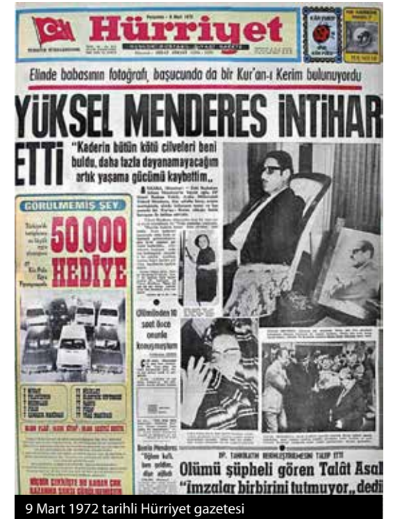
9 Mart 1972 tarihli Hürriyet gazetesi