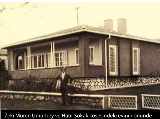
Zeki Müren Umurbey ve Hatır Sokak köşesindeki evinin önünde