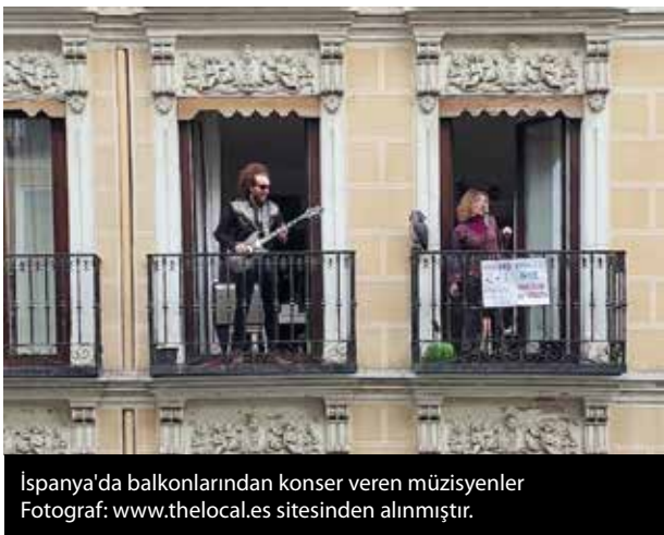
İspanya'da balkonlarından konser veren müzisyenler

girişimcilere keşfedilmek, yeni ürünlerini tanıtmak veya atık üretimlerini azaltmak gibi konularda çözümler sunan Wriggle, Covid-19 salgınının işletmelerin bağımsızlığını çok hızlı bir biçimde etkileyeceğini görüp, kullanıcılarını, ücretleri 5 ila 40 sterlin arasında değişen kuponlar ile ileriye dönük alışverişler yaparak sevdikleri kafelere önümüzdeki birkaç ay boyunca devamlı bir gelir sunmaya davet ediyor. Bu sayede işletmelerin en azından kira ve maaş gibi temel giderleri karşılamasına ön ayak olmuş oluyor.