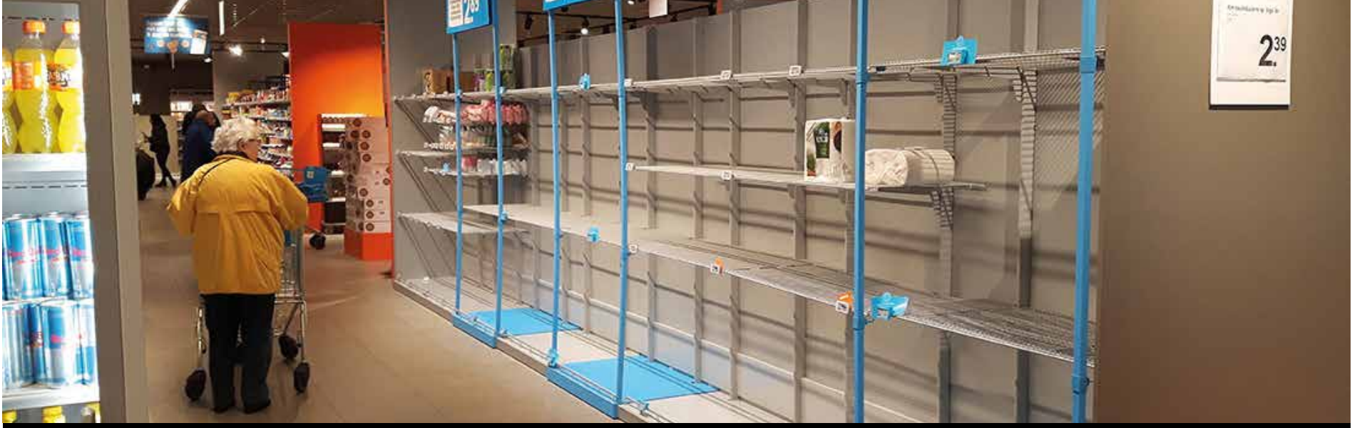
Yeterince mobil olmayan yaşlıların alışveriş yapması güçleşiyor.

Salgının ilk haftasından itibaren Hollanda'nın her yerinde kentliler bu tip ihtiyaçlara cevap vermek üzere sosyal medya üzerinden çok hızlı bir biçimde organize oldu. Her şehir için farklı kanallar açıldı, gruplar kuruldu. Fakat yaş ortalaması arttıkça sosyal medya kanallarına erişim azaldığından, bu şekilde yeterince insana yardım edemiyor olduğumuzu gördük. Grup üyelerinin güvenilirliğini teyit ettikten sonra, el ilanları bastırıp bunları kendi mahallerimizdeki evlerin posta kutularına bıraktık. İlan kısaca 'bizler risk grubunda olmayan komşularınız, sizin sağlığınızı tehlikeye atmadan alışverişinizi yapmak, köpeğinizi gezdirmek gibi gündelik işlerinizde yardımcı olabiliriz' diyor. Henüz Hollanda'da durum bu vahamette olmamasına rağmen, gidişatın belirsizliğine karşı yardımlaşma