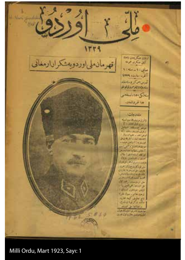
Milli Ordu, Mart 1923, Sayı: 1