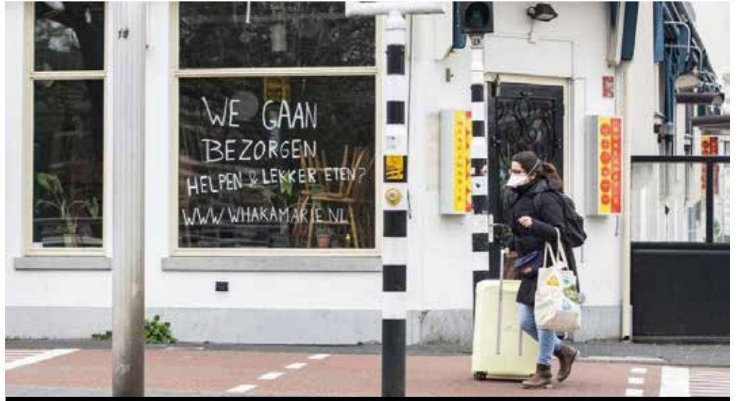
Evlere servis yapabileceğini vitrininde duyuran kapalı bir restoran

Aslında bu bölüm için çok farklı planlarım vardı. Mutluluk ekonomisinden, Finlandiya gibi soğuk ve karanlık bir ülkenin nasıl üst üste iki sene Birleşmiş Milletler tarafından dünyanın en mutlu ülkesi seçilebildiğinden ve insanların mutluluk anlayışının doğa ile nasıl bağdaştığından söz edecektim. Hatta bu konu için bir arkadaşımın ufak bir röportaj yapmıştım. Fakat yeni Corona virüsüne bağlı Covid-19 hastalığının dünyaya yayılarak yüz binin üzerinde can almasıyla gündem öyle hızlı değişti ki, mutluluk konusu önümüzdeki sayılara kaldı.