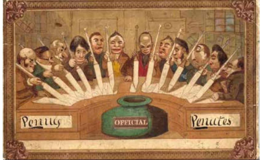
Who Invented Postcards? https://www.prunrunner.com/blog/who-invented-postcards/

Postcrossing'in bu eşitlikçi mantığı internet sayfasının kullanımına da yansıyor. Sisteme erişim ücretsiz... Sitenin kullanımı da oldukça basit... Siteye girip ücretsiz olarak üye oluyorsunuz. Kendinize bir profil fotoğrafı seçip bir hesap oluşturuyorsunuz. Kendinizi kısaca anlatan bir tanıtım yazısı yazıyorsunuz. Ve sonra, ilk kartpostalınızı yollamak için rastgele bir Postcard tanımlama numarası ve adres alıyorsunuz. Kimbilir, kim çıkacak karşınıza? Şimdi tek yapmanız gereken, tanımlama numarasını ve tabii adresi yazmayı unutmadan, kartı doldurup en yakın postaneye gidip atmak. Postcrossing sistemi geleneksel usulle işliyor. Kartpostalı zarfsız yolluyorsunuz. Bir de sistem olabildiğince farklı insanın birbiriyle temasını hedeflediğinden karta kendi adresinizi yazmıyorsunuz. Kartpostalı yolladığınız kişi kartpostal kendisine ulaşınca üzerindeki tanımlama numarasını sisteme kaydediyor. Böylece kartınızın ulaştığını görüyorsunuz ve kartpostal almaya hak kazanıyorsunuz! 3