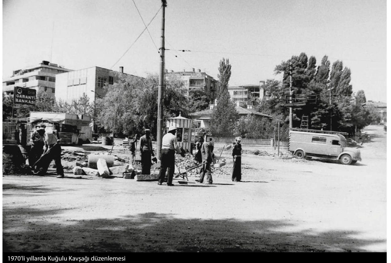
1970'li yıllarda Kuğulu Kavşağı düzenlemesi