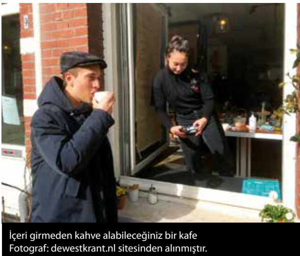
İçeri girmeden kahve alabileceğiniz bir kafe

İstatistikler bu sürecin beklediğimizden daha uzun olacağını gösteriyor. Yine de ben durumun bir nebze düzeleceğini umarak, gelecek sayıda dünyanın en mutlu ülkesi Finlandiya'dan, mutluluğun Finler için ne anlama geldiğinden, mutluluk ekonomisinden ve mutlu olmanın öğrenilen bir şey olduğu prensibiyle kurulan mutluluk okulundan bahsedeceğim. Sağlıkla kalın.