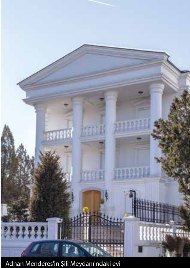
Adnan Menderes'in Şili Meydanı'ndaki evi

döndüğümüzde karşımızda bembeyaz, sütunlu, mimari olarak hangi tarza benzeteceğimi bilemediğim, yıllarca dönemini çıkaramadığım binaya bakıyoruz. Bugün bir holdingin misafirhanesi olarak kullanılan, önünden geçtiğim 25 yılda kendi gibi bembeyaz panjurlarını sadece bir kez açık gördüğüm bina 1950-1960 yılları arasında başbakanlık görevinde bulunan Adnan Menderes'in evi, bu şekilde de tescillenmiş. Elbette o yaşarken böyle gösterişli, kremaya bulanmış pasta gibi bir ev değilmiş. Gayet modern hatlara sahip güzel mütevazı bir ev şirket tarafından satın alındıktan sonra bugünkü haline getirilmiş. Fotoğraf 70'lerin başından olmalı, bildiğim kadarıyla Kuğulu Kavşak düzenlemesine ait. Fotoğrafın sağ tarafından yukarıda eski haline dair bazı fikirler edinebiliyoruz.